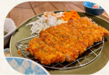
定食のメインは応相談